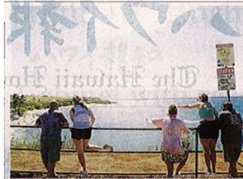
ホオキバ・ビーチでサーファーとウィンドサーファーを阻める観光客—10日、マウイ島/イア

【ホノルル・スター・アドバタイザー】最新のオミクロン変種をターゲットにした新型コロナ(COVID-19)の新しいワクチンが、近々ハワイで入手可能になる。ハワイでロングス・ドラッグスを運営するCVSファーマシーは、20日から新ワクチンが入荷し、週を通して順次在庫を確保する予定だ。 ハワイ・パンフィック・ヘルスの品質管理主任、ルバ・パテル医師は、重症化、入院、死亡を予防するために、生後6カ月以上の大人に新しいワクチンの接種を勧めている。ファイザー社とモデルナ社による最新の新型コロナのワクチンは、現在 【ホノルル・スター・アドバタイザー】最新のオミクロン変種をターゲットにした新型コロナ(COVID-19)の新しいワクチンが、近々ハワイで入手可能になる。ハワイでロングス・ドラッグスを運営するCVSファーマシーは、20日から新ワクチンが入荷し、週を通して順次在庫を確保する予定だ。 FDAによると、XBB.1.5は、米国でもはや流行していないが、現在流行している変異体、EG.5と日A.2.86を中和する効果があることが明らかにされたという。このワクチンは、米国では現在使用が許可されていない二価のブースターに代わるもので、こ