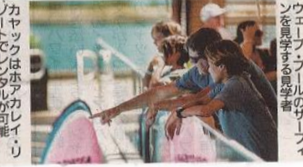
立ち乗りサーフィンができる幅1000フィートの波は、50坪のサイズのワイカイ