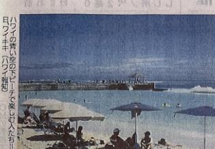
2024年までの前年比成長予測