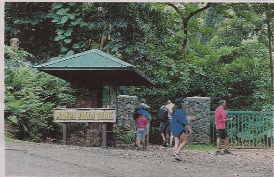
2年ぶりに再開したマノア滝トレイルの入り口

ヘブンは、例えはエヴァービッチでは先月、89万9千ドルで売却に出された住宅がわずか8日後に、提示価格より7万8千ドル高い97万7千ドルで売却されたという。在庫不足により二戸ロケーションズは報告