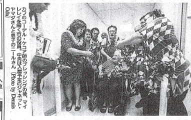
マッカー市、ホノルル市のワシントン通りとアロハ通りの間に、高齢者のホームレス向けの全タワースタパート完成。今年末の開業を目指して10ヵ月を費やした。住居に改修したの建物。クムワムと改修は、20人が入居予定。入居後は毎月収入ホノルル市補助金500ドルをもち、200以上のホノルル市に提供される。

「ホノルル・スター・アパルトマン」マッカー市のワシントン通りとアロハ通りの間に、高齢者のホームレス向けの全タワースタパート完成。今年末の開業を目指して10ヵ月を費やした。住居に改修したの建物。クムワムと改修は、20人が入居予定。入居後は毎月収入ホノルル市補助金500ドルをもち、200以上のホノルル市に提供される。