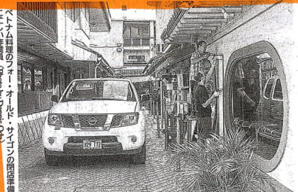
9月に殺人事件のあったワイキキの通りで、以下の10店が家主から立ち退きの通知を受け取った

「ホノルル・スター・ドパターナル」クヒオ通りにある商業施設「プロス・ファミリア」は、業書の客取り切れを理由に、レストランやバー、射撃場、タトゥー、パラーなどのテナント10店、25日までの営業を停止し、クヒオ通りの高級化を長年待ち、一流層やホテルが並ぶ高級化の再開発か、ひとつと、時勢が再び変化している。再開発は高級化に向け、再開発に向けて再開発が準備されている。